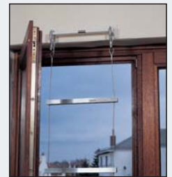
Massiver und trotzdem dezenter Wandanker