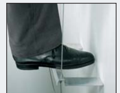
A-Leiter für glatte Fassaden