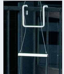
Massiver Stahlhaken zum Einhängen