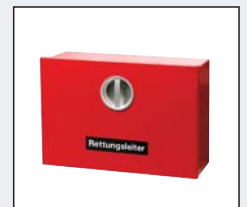
Wandbox zur ortsfesten Aufbewahrung