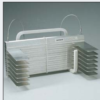
KF-Kompakt-A5 mit Abstandshaltern